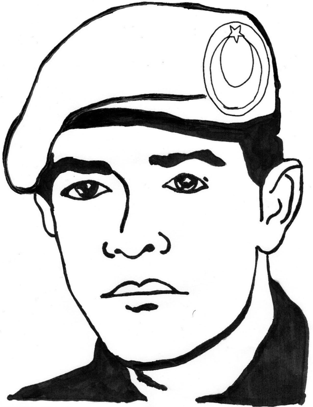
ÖMER HALİSDEMİR :